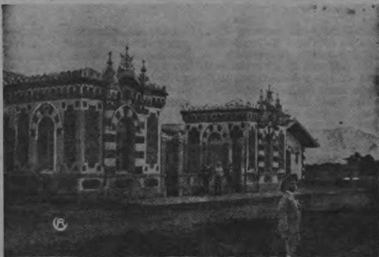
No cabe duda de que muchas de las cosas viejas fueron mejores que las de ahora. Los señores municipales pueden recrearse la vista con este viejo matadero (Rastro) de la capital.